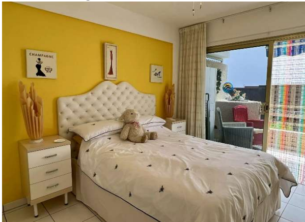
Schlafzimmer mit Doppelbett, großer Einbauschränk